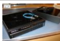
Pre-amplificatori Meridian 561 +... € 1.200,00